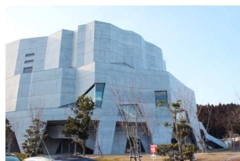
大船渡市 リアスホールにて開催された「いま、ここで生きている」展は、大切な皆さんとの嬉しい再会と新たな出会いの喜びに溢れた5日間となりました。南相馬、石巻、大船渡で託された思いを乗せ、次は盛岡市へ巡回します！