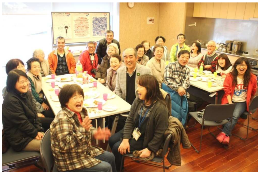
初日に開催した交流会では、嬉しい再会が相次ぎ皆さんとの楽しい交流の時間となりました。