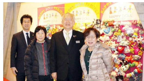
公務で施設を訪問していた市長、副市長にもご寛頂きました！