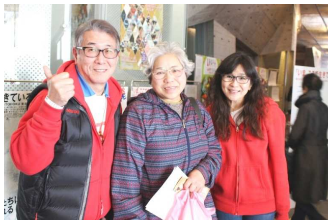
震災直後に訪問した仮設住宅の方との再会。共に当時を振り返り、今回の再会に心から嬉しい喜びを感じました。