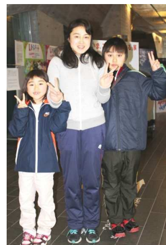
プログラムやキャンプに参加してくれた子どもたちの嬉しい再会もありました！