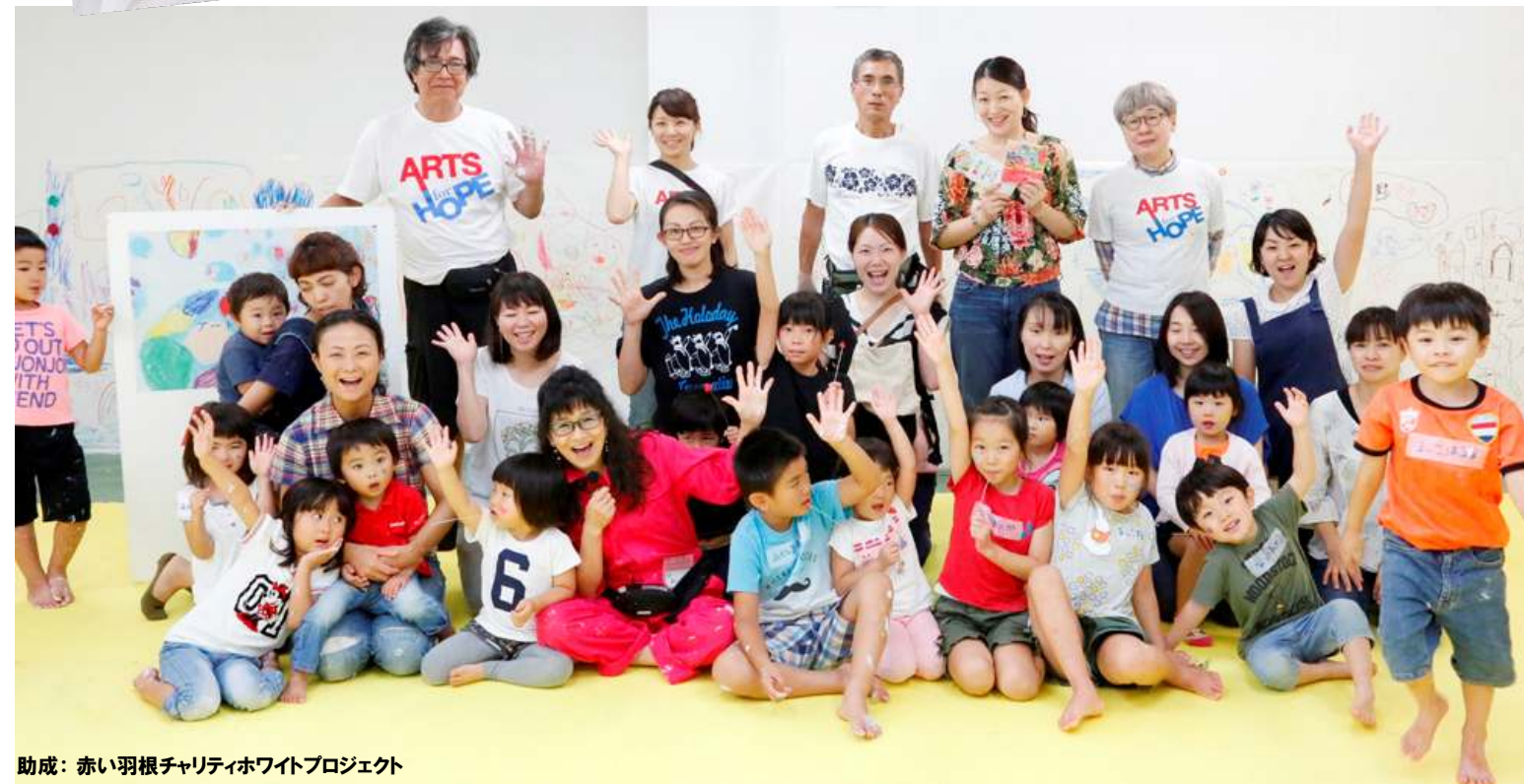
助成：赤い羽根チャリティホワイトプロジェクト