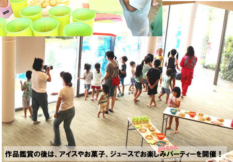
作品鑑賞の後は、アイスやお菓子、ジュースでお楽しみパーティーを開催！