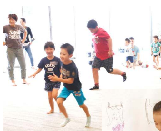
待ちに待ったお絵描き！子どもたちはキャンバスへ駆け寄りました。