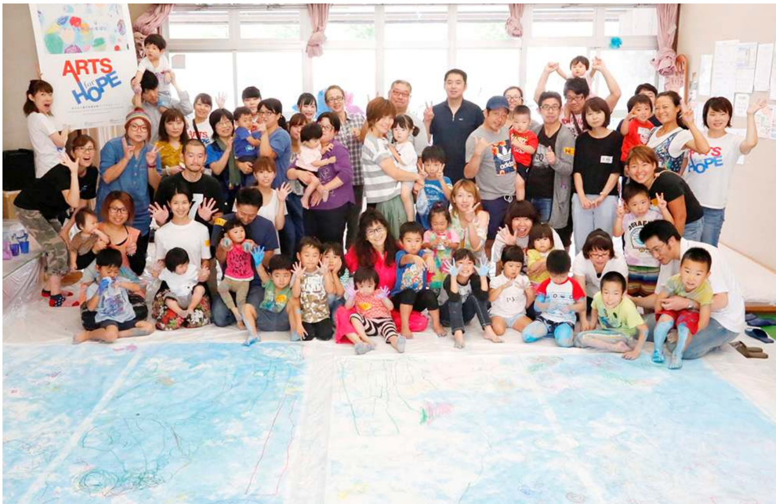
助成：赤い羽根チャリティホワイトプロジェクト