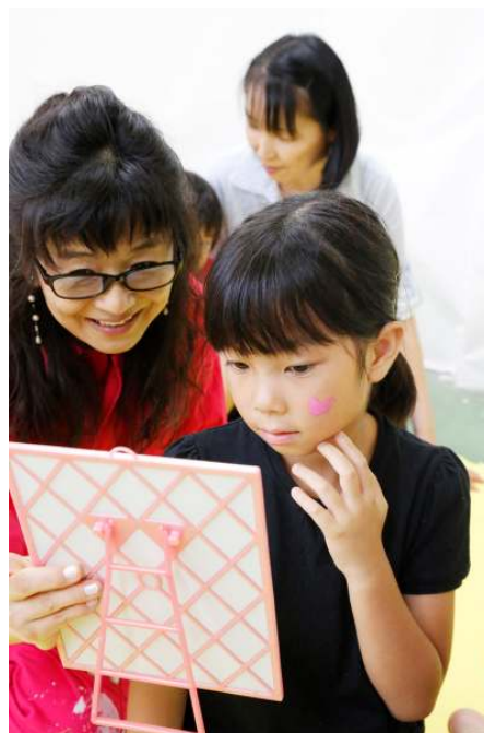
フェイスペインティングも開催！子どもたちの顔や手に素敵なペイントが施されました。