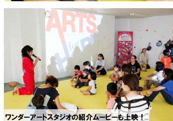
ワンダーアートスタジオの紹介ムービーも上映！