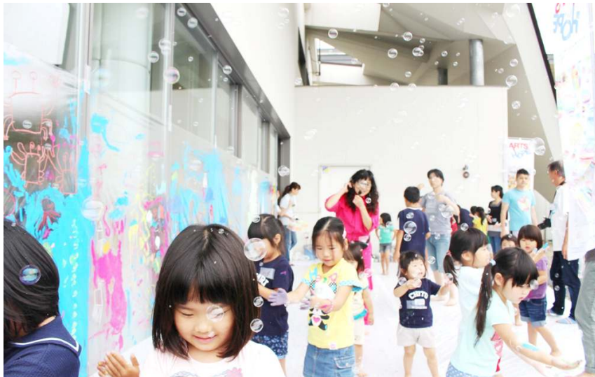
水族館の完成を祝すシャボン玉のサプライズに子どもたちは大はしゃぎでした。