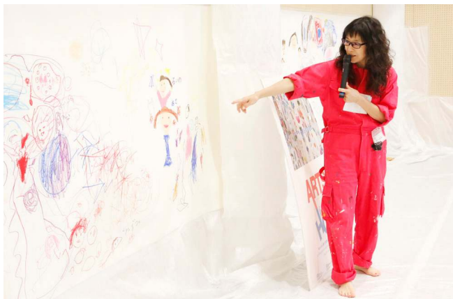
大好きなお友だちを描き、完成後は他の子どもたちの絵を鑑賞！