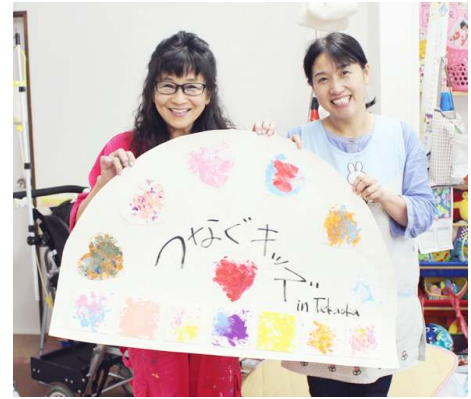
「子どもたちの作品を施設のシンボルにしたい」という先生方のリクエストにお応えし、子どもたちの作品を組み合わせ、施設のシンボルが完成しました。