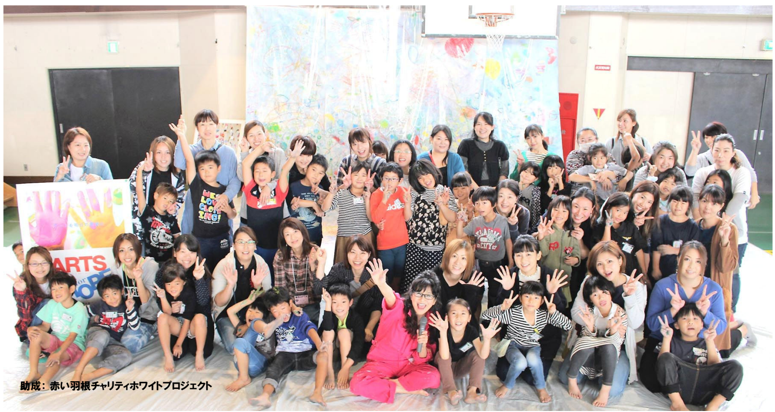
助成：赤い羽根チャリティホワイトプロジェクト