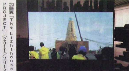
「カタストロフと美術のちから展」

明確な問題意識に根ざす佳作が多く、想像を刺激する発想や活動にうなづいた。ただ個人的悲劇を主題にした展示作もあり、企画趣旨がややぼけたように感じられるのが惜まれる。来年1月20日まで。【永田晶子】