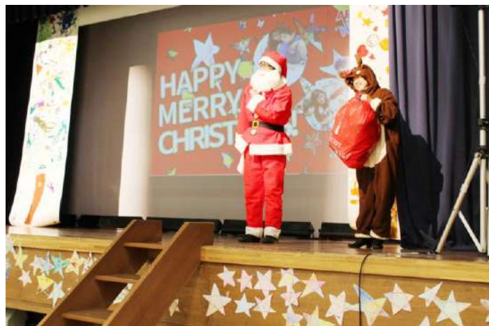
クライマックスにはサンタクロースとトナカイが登場！1人1人に贈られたプレゼントに子どもたちは大喜びでした。