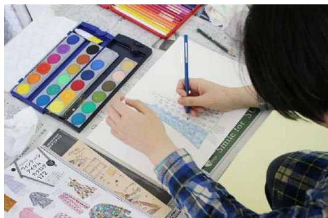
ワンピースを色鉛筆と絵の具で彩色し完成させました。その後、モールや星型のパーツ等手芸材料で作品づくりを行いました。