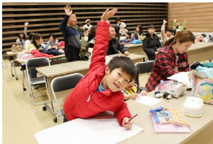
「みんな今日は楽しかったかな～？」の声掛けに、子どもたちの手が一斉に上がりました！