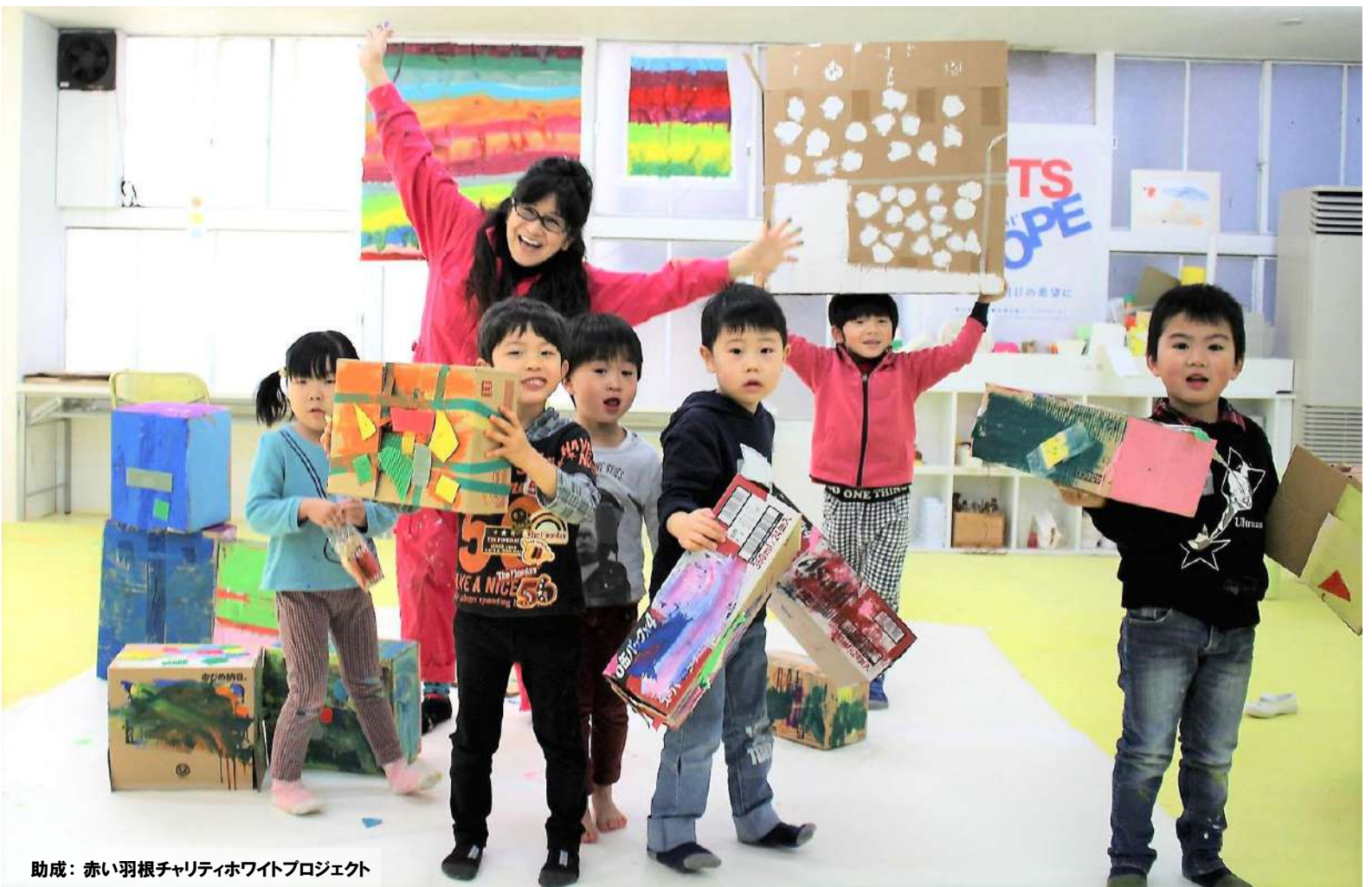
助成：赤い羽根チャリティホワイトプロジェクト