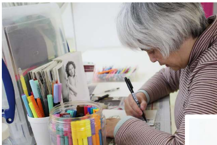
「女性と子どものヌード。女性のヌード。足が一本映っている写真から3枚の作品を、クレヨン、マジックペン等を使い仕上げました。

仙台市 ワンダーアートスタジオにて「おとなのボーダレスアートプログラム」を開催しました。