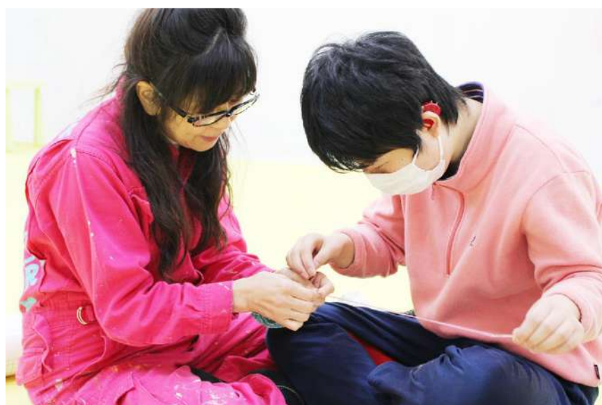
ドローイングと手芸材料による創作。針が進むにつれて、心が落ち着いていく様子でした。今回は4つの作品を完成させました。