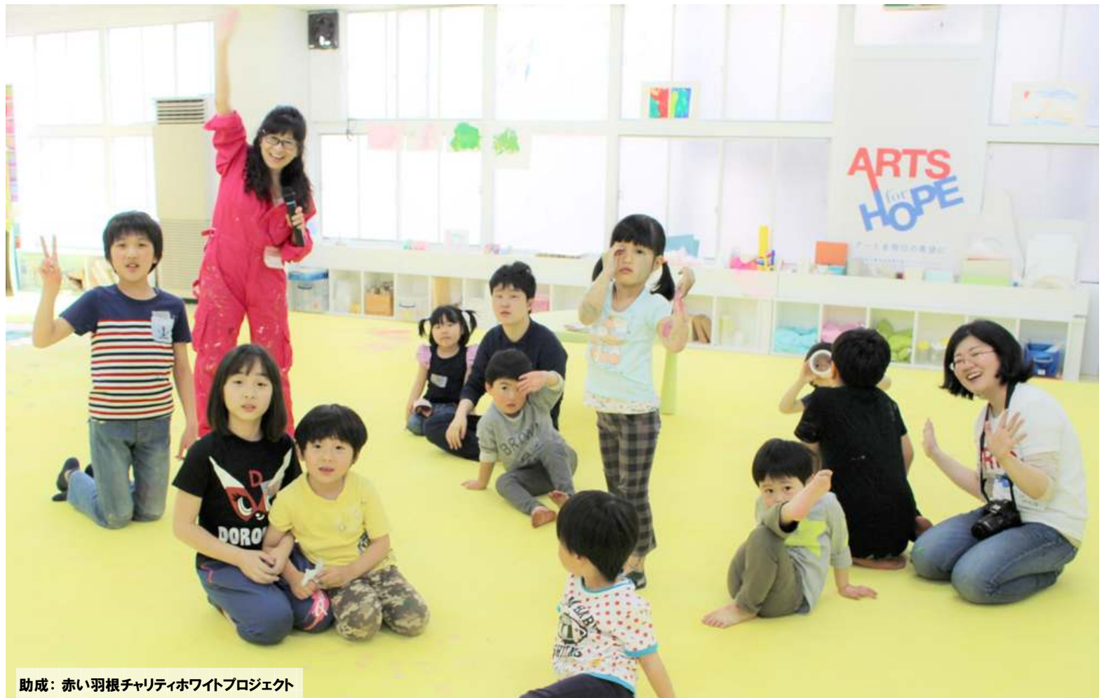
助成：赤い羽根チャリティホワイトプロジェクト