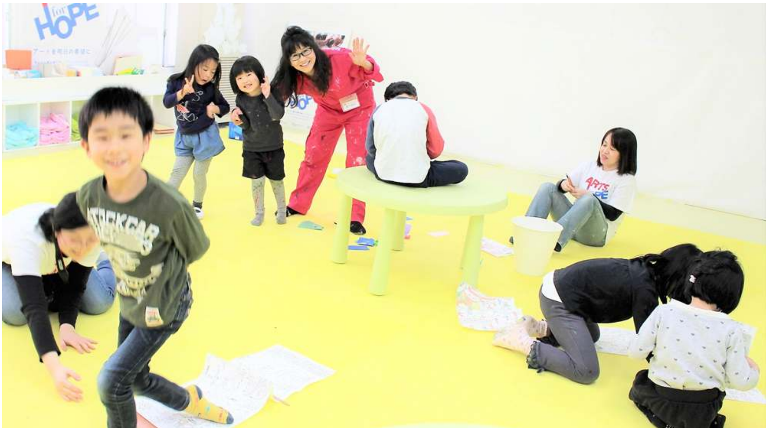
助成：赤い羽根チャリティホワイトプロジェクト