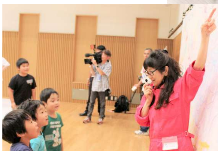
今日描いた作品はたからもの！