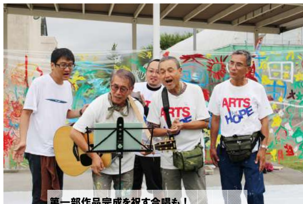
第一部作品完成を祝す合唱も！