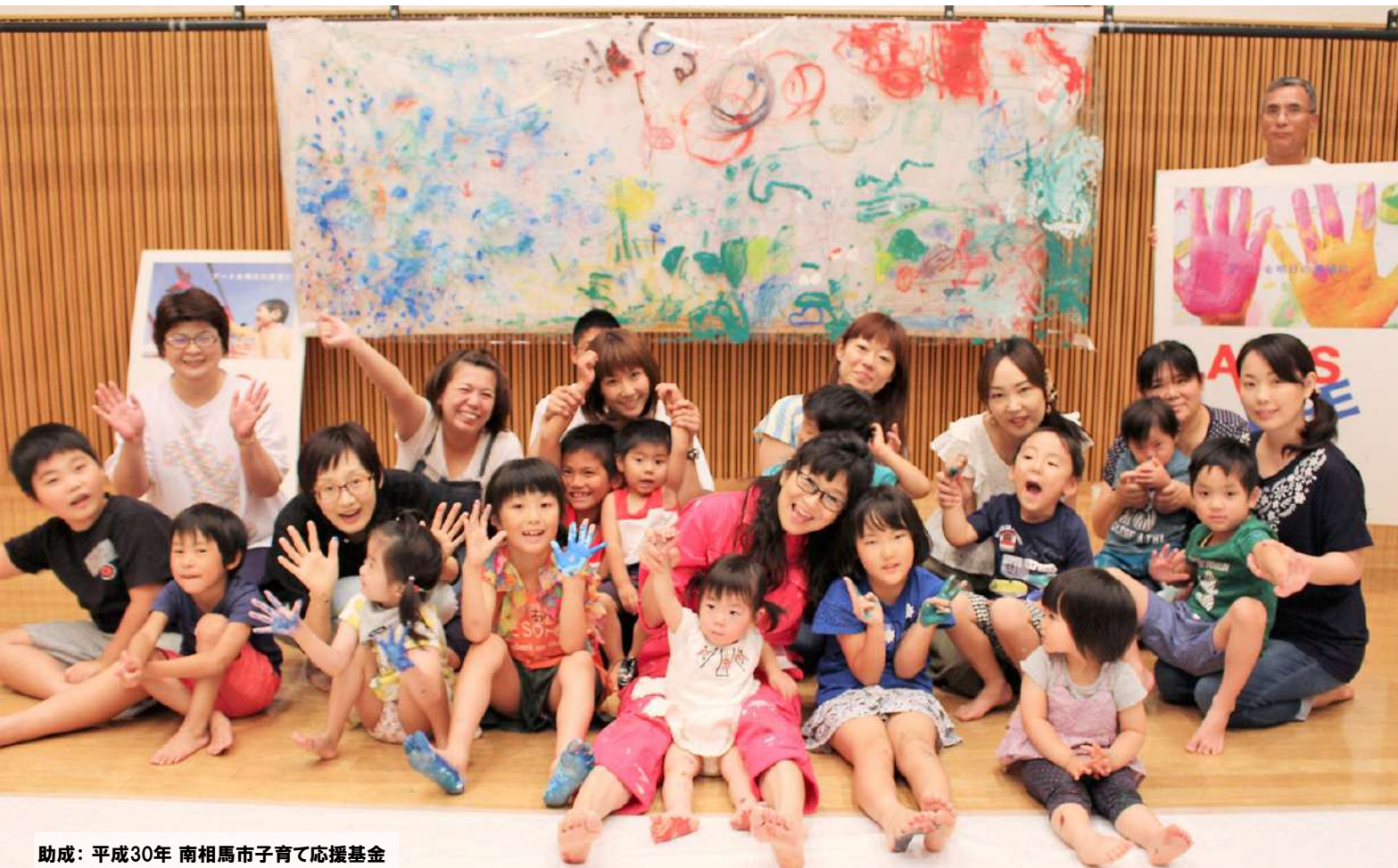
助成：平成30年 南相馬市子育て応援基金