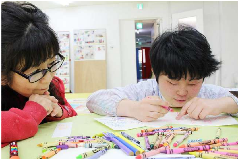
クレヨンで描き続け、最後は久しぶりに絵の具をリクエスト。混ざり合う色を感じながら描きました。

ついで フレッシュ クレヨン ボーダレスアートスタジオ Wonder Art Studio