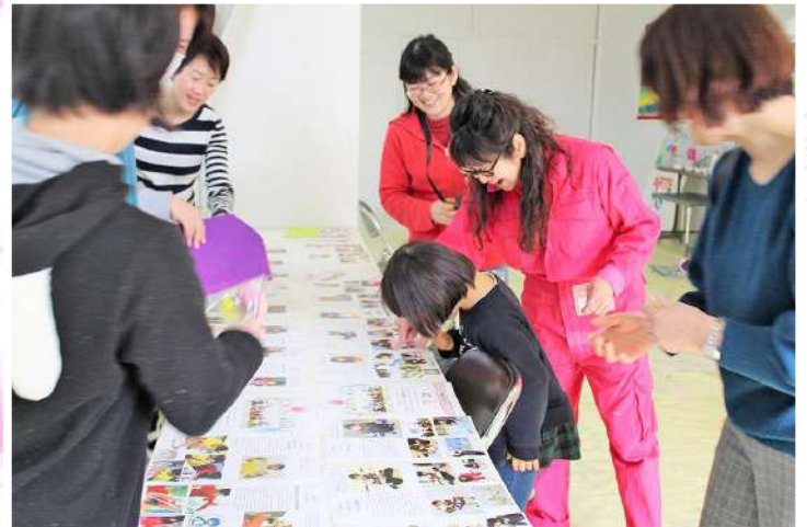
半年間の個人レポートを振り返り、子どもたちの成長を感じました。