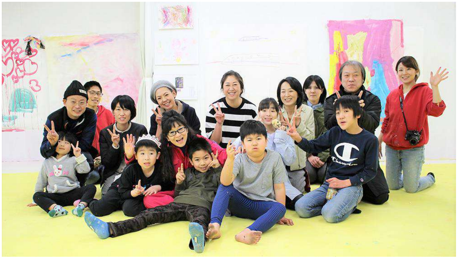
⑤2019年3月1日 宮城県仙台市 <Wonder Art Studio> 「おとなのボーダレスアート」 仙台市 ワンダーアートスタジオにてボーダレスアート「おとなのボーダレスアート プログラム」を開催しました。

ついで フレッシュ クレヨン ボーダレスアートスタジオ Wonder Art Studio