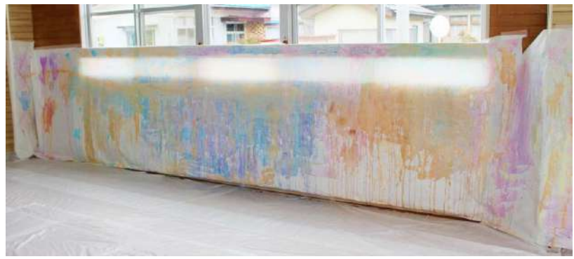
助成:平成31年度 南相馬市子育て応援基金