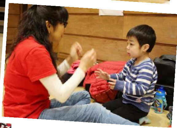
子どもたちは、Happy Dollをつくらたり、絵を描いたり、シャボン玉で遊んだり、さまざまなことを楽しみました。