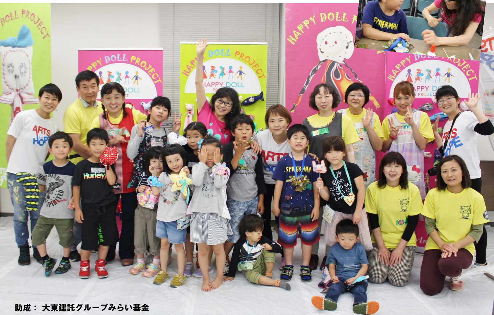
助成：大東建託グループみらい基金