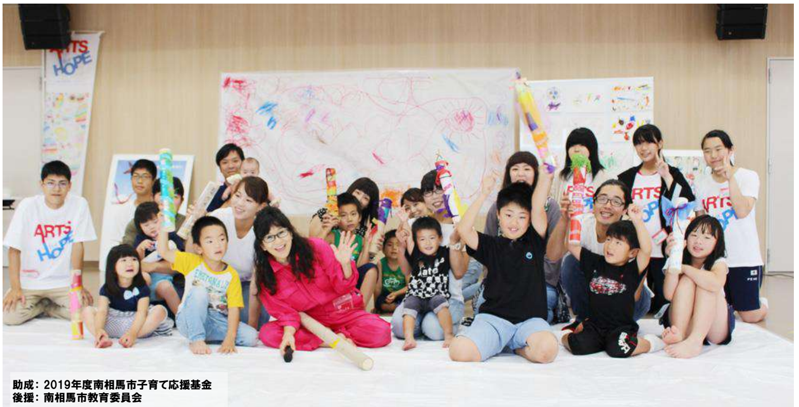
助成：2019年度南相馬市子育て応援基金 後援：南相馬市教育委員会