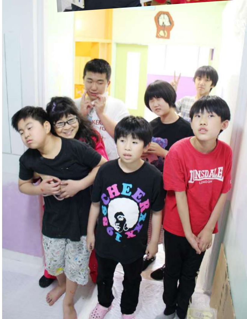
助成：社会福祉法人丸紅基金（施設修繕工事）、公益財団法人ノエビアグリーン財団（アートリノベーション）