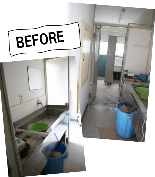
助成：社会福祉法人丸紅基金（施設修繕工事）、公益財団法人ノエビアグリーン財団（アトリノベーション）