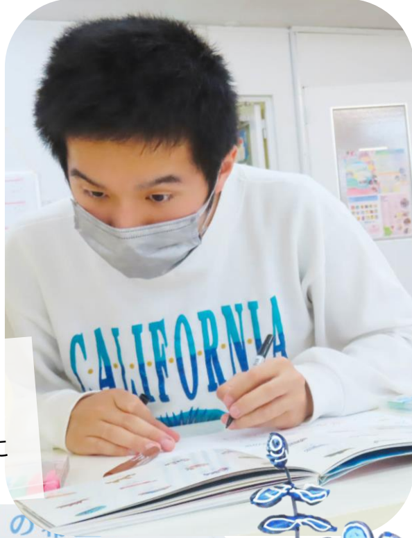
●11月19日 宮城県仙台市〈Wonder Art Studio〉 「ボードレスアートおとな土曜クラス」 いつもと違う素材に挑戦。衣服やガラスに ペイントして、新しい作品が出来ました！