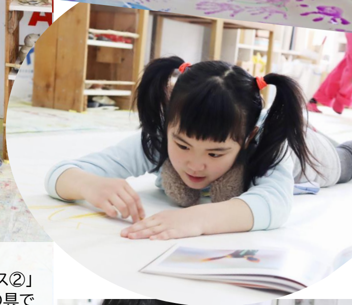
●4月17日 宮城県仙台市 <Wonder Art Studio>「ボードレスアート子ども日AM曜クラス②」 ドキドキの初対面。初めは少しギクシャクしていましたが、手を絵の具で いっぱいにして描くうちに自然とコミュニケーションが生まれました。