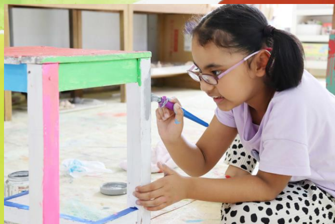
●8月21日 宮城県仙台市 〈Wonder Art Studio〉 「ボーダレスアートこども日曜AMクラス②」 ペンキ塗りにツールのペイント、粘土に水彩 画、いろいろ挑戦しました！