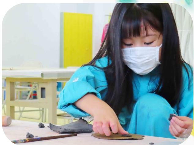
●8月21日 宮城県仙台市 〈Wonder Art Studio〉 「ボーダレスアートこども日曜PMクラス②」 たくさん描いて、たくさん遊んで、今回もエネルギーいっ ぱいの子どもたちとのアートの時間でした。