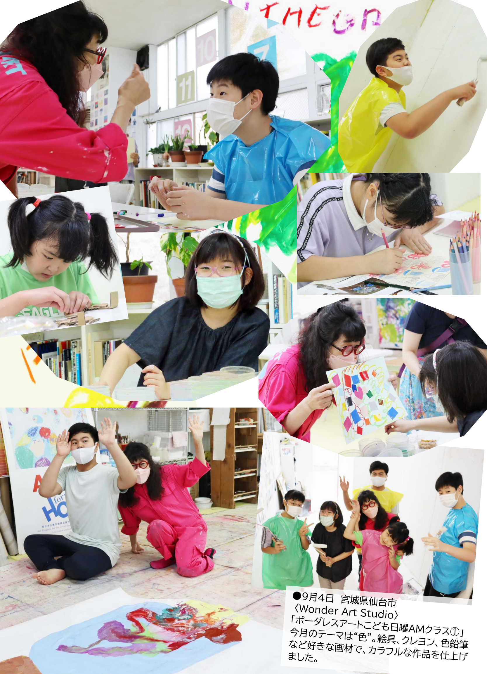
●9月4日 宮城県仙台市 〈Wonder Art Studio〉 「ボーダレスアートこども日曜AMクラス①」 今月のテーマは“色”。絵具、クレヨン、色鉛筆 など好きな画材で、カラフルな作品を仕上げ ました。