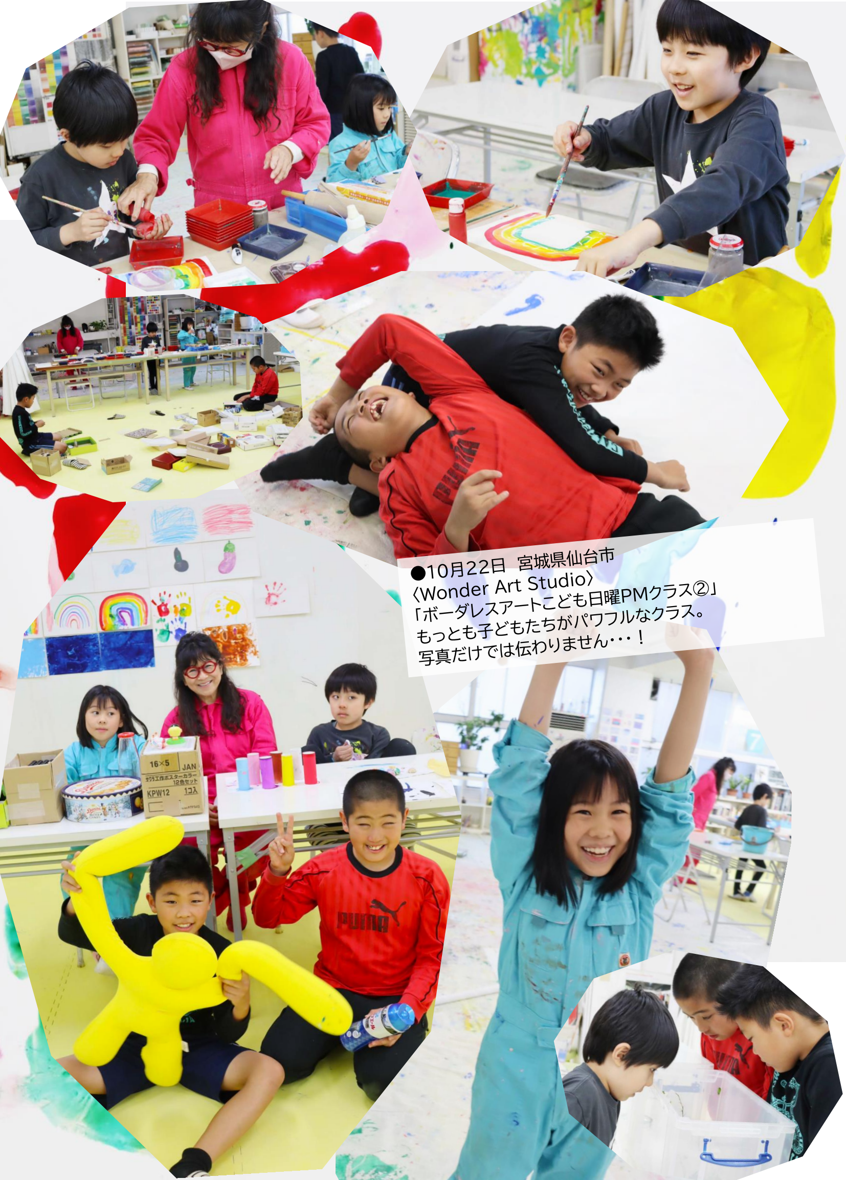
●10月22日 宮城県仙台市 〈Wonder Art Studio〉 「ボードレスアートこども日曜PMクラス②」 もっとも子どもたちがパワフルなクラス。 写真だけでは伝わりません・・・！