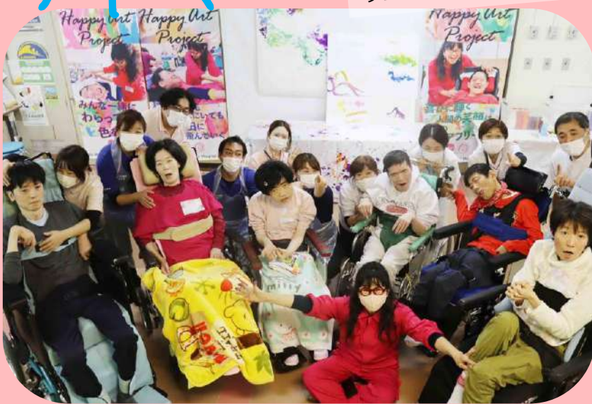
助成：田辺三菱製薬手のひらパートナープログラム