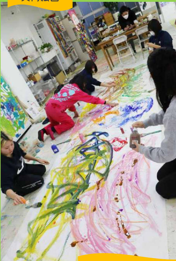
ブラインドドローイング