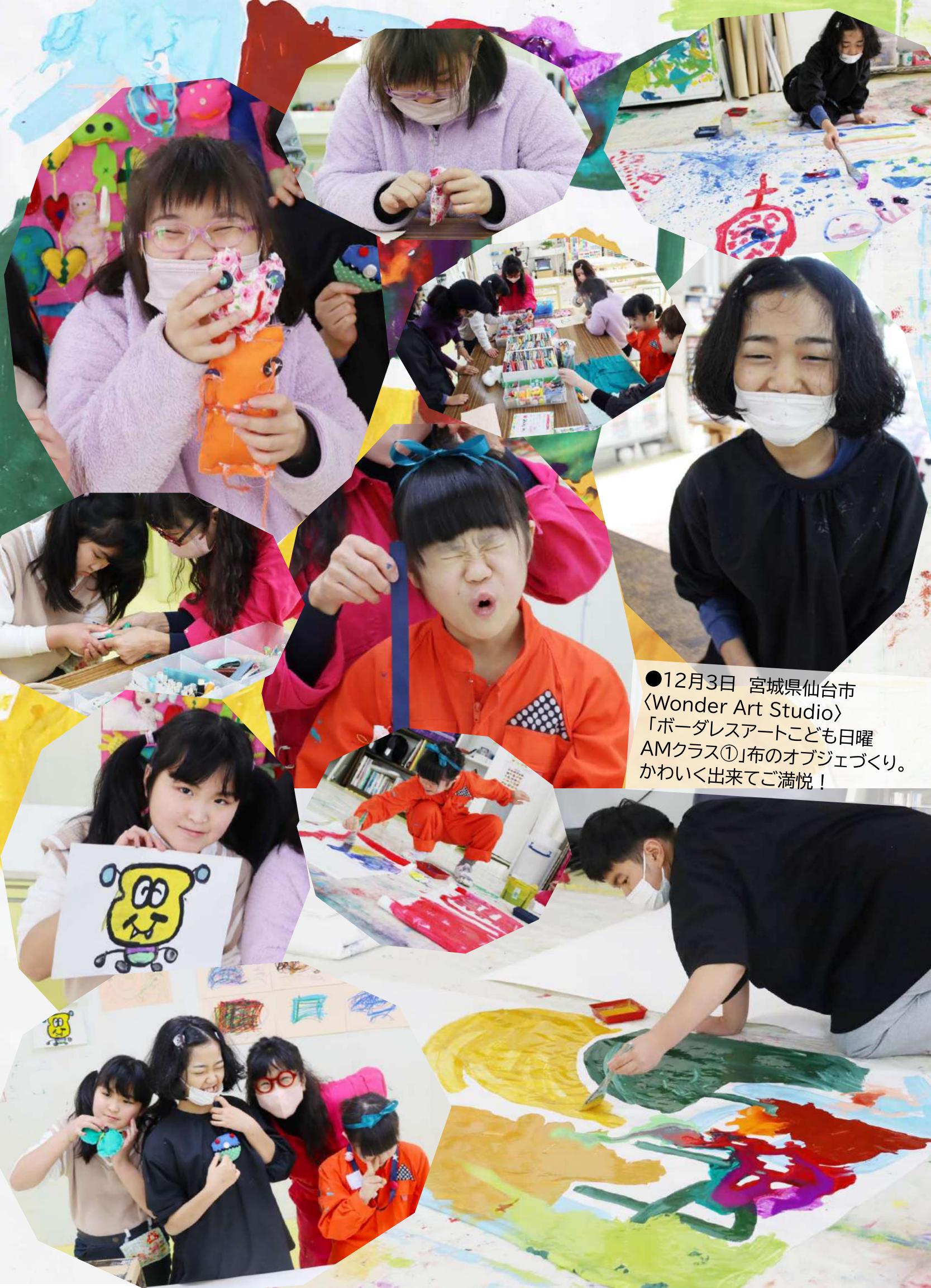
●12月3日 宮城県仙台市 〈Wonder Art Studio〉 「ボーダレスアートこども日曜 AMクラス①」布のオブジェづくり。 かわいく出来てご満悦!