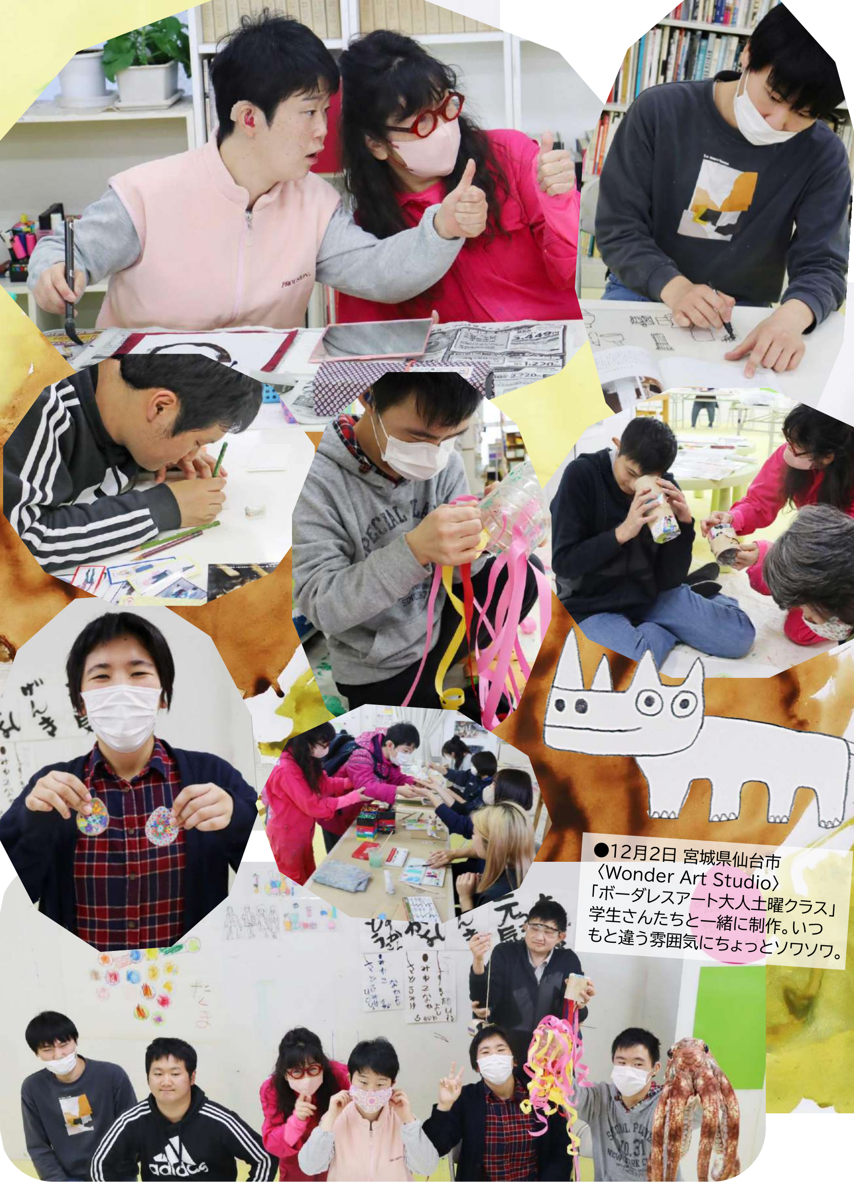
●12月2日 宮城県仙台市 〈Wonder Art Studio〉 「ボーダレスアート大人土曜クラス」 学生さんたちと一緒に制作。いつ もと違う雰囲気になちょっとソワソワ。