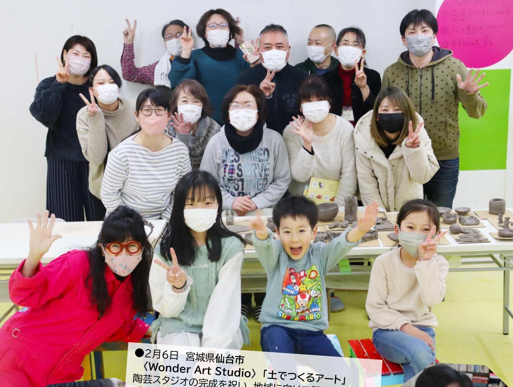
●2月6日 宮城県仙台市 〈Wonder Art Studio〉「土でつくるアート」 陶芸スタジオの完成を祝い、地域に向けて開催した特別 プログラム。バラエティ豊かな作品が生まれ、皆さんのク リエイティブにびっくり！次回の絵付けも楽しみです！