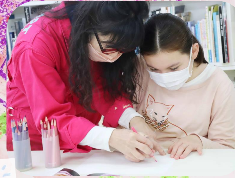
●2月5日 宮城県仙台市 〈Wonder Art Studio〉 「ボードレスアート子ども日曜PMクラス②」 柔らかい色彩の花、ビビッドな花、色鉛筆で描いた繊細な花…。 それぞれの優しさが滲む、いろんな花が出来ました。