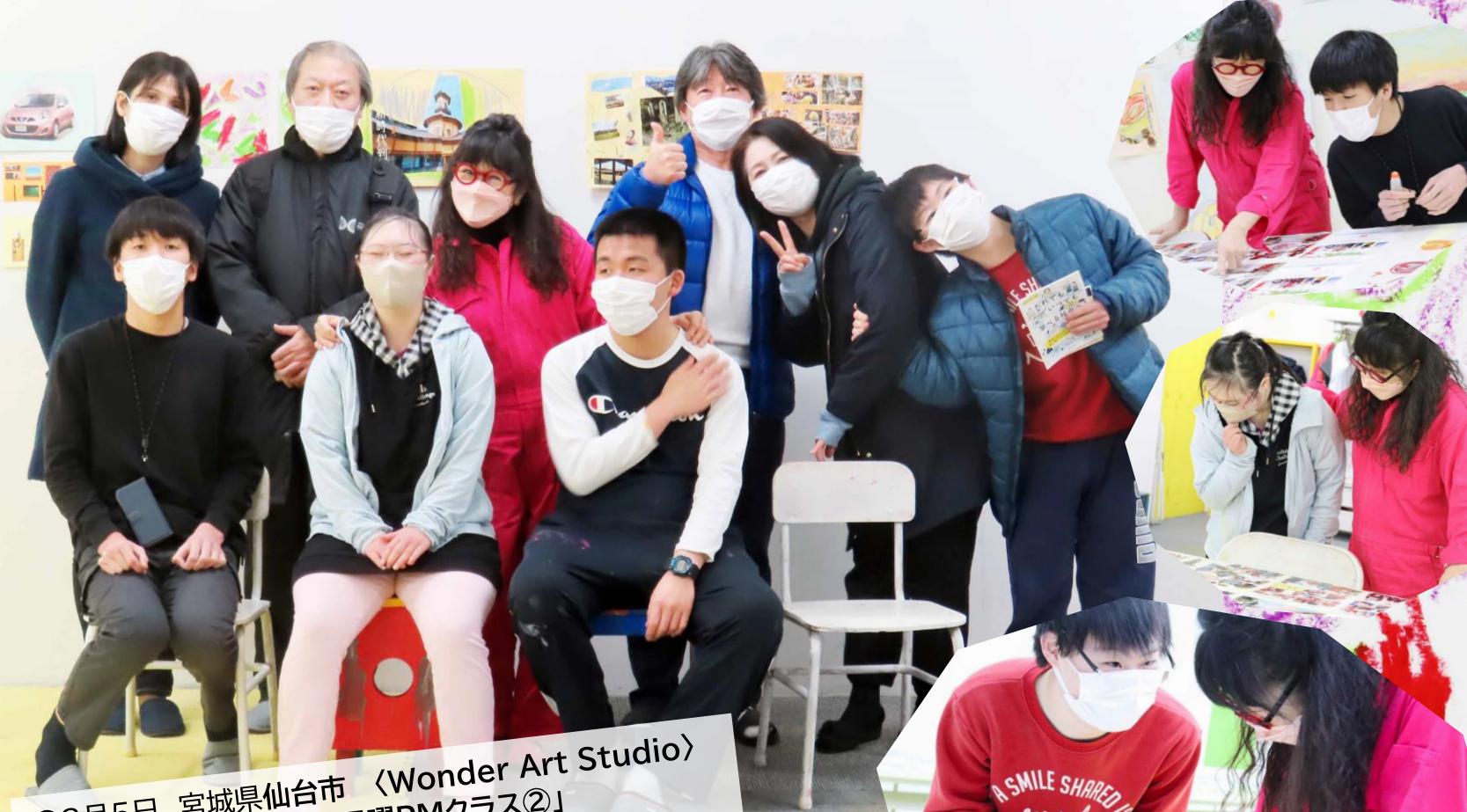
●3月5日 宮城県仙台市 〈Wonder Art Studio〉 「ボードレスアート子ども日曜PMクラス②」 お洒落でカッコいいものや落ち着いた渋めのもの。 コラージュにも作風の違いがくっきり表れ、楽しい作品 鑑賞でした。