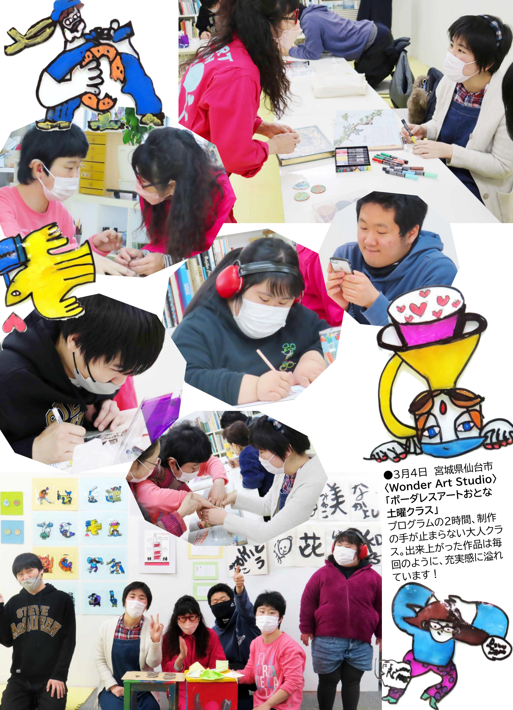
●3月4日 宮城県仙台市 〈Wonder Art Studio〉 「ボーダレスアートおとな 土曜クラス」 プログラムの2時間、制作 の手が止まらない大人クラ ス。出来上がった作品は毎 回のように、充実感に溢れ ています！