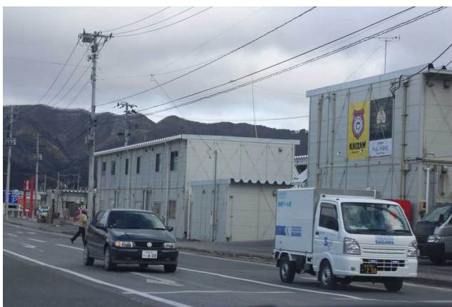
復興商店街近辺でもかさ上げ工事が進められていた。