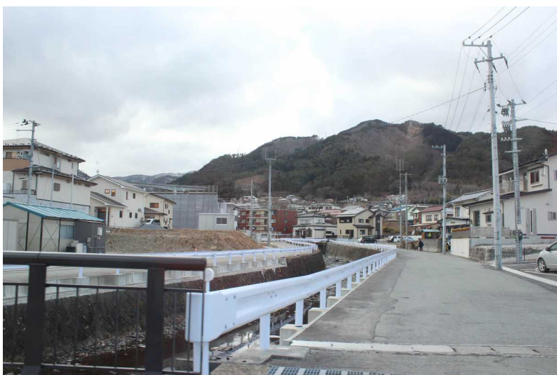
震災直後とはまるで違う景色の中に、川を逆行して乗上げた船や瓦礫の山の記憶を思い出す。(左写真2枚が震災直後の様子)